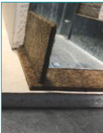
Taglio termoacustico con Nobilium®Thermalpanel da 3mm per le strutture a “secco”.