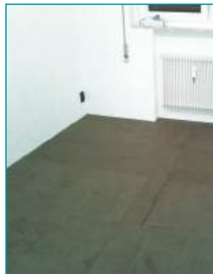
Nobilium®Thermalpanel per l'isolazione termo-acustica a pavimento.