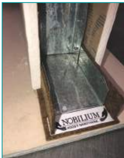
Taglio termoacustico con Nobilium®Thermalpanel da 3mm per le strutture a “secco”.