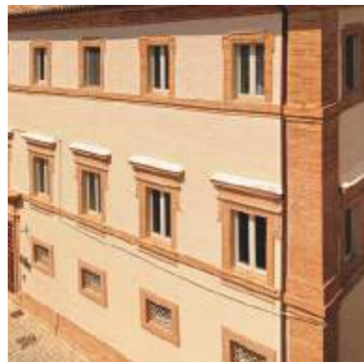
Soluzione NOBILIUM® THERMALPANEL per edifici storici

L'intervento di risanamento interno comporta una attenta progettazione e valutazione dei materiali e dei sistemi adottati, che se sottovalutata potrebbe portare a risultati indesiderati; per questo l'uso del basso spessore NOBILIUM®THERMALPANEL ben si sposa anche in abbinamento all'impiego di "cappotti" interni e/o esterni che utilizzano materiali a spessore "tradizionale", in quanto ne completerebbe il risultato finale "scomparendo" alla vista del cliente annegato nello spessore dell'intonaco.