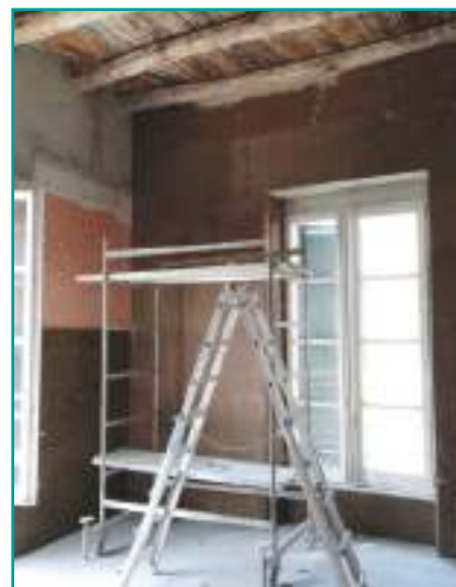
Nobilium®Thermalpanel per la ristrutturazione edifici storici/rustici.