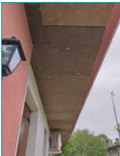
Nobilium®Thermalpanel come correzione ponte termico esterno