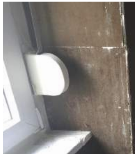
Soluzione NOBILIUM® THERMALPANEL per edifici storici