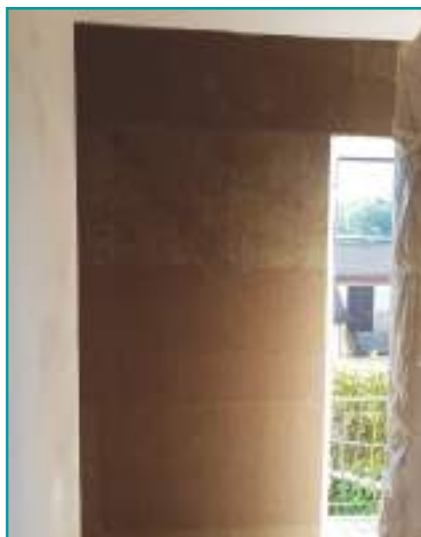
Nobilium®Thermalpanel posato su parete interna senza uso di tasselli con ciclo di calce naturale.