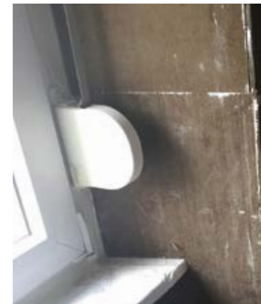
Solution NOBILIUM® THERMALPANEL pour bâtiments historiques