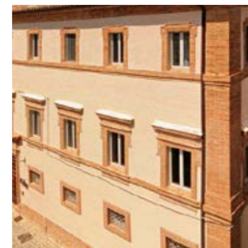
Solution NOBILIUM® THERMALPANEL pour bâtiments historiques

L'intervention de restauration interne implique une conception et une évaluation soigneuses des matériaux et des systèmes adoptés, qui, en cas de sous-estimation, pourraient conduire à des résultats non désirés. Par conséquent, le produit NOBILIUM® THERMALPANEL de faible épaisseur peut être employé avec des « couches » intérieures et/ou extérieures utilisant des matériaux d'épaisseur « traditionnelle », car il complète le résultat final en « disparaissant » dans l'enduit.